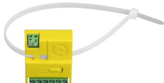
Przepust montażowy w obudowie umożliwia montaż opaski zaciskowej.

Oba kanały sterownika pracują jako monostabilne 1s, rejestrowane są piloty Flor, niektóre piloty Roger oraz piloty HCS, można klonować zdalnie pilota, można uzyskać pozycję pilota po pięciokrotnym naciśnięciu zarejestrowanego przycisku.