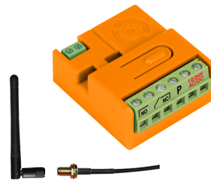
antena 434MHz - opcja

staje włączony przez zaprogramowany czas 1, 3, 5, 25s, naciśnięcie przycisku pilota podczas załączonego przełącznika skracza czas jego załączenia,