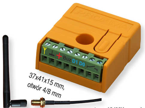
antena 434MHz - opcja

Nadajnik - odbiera radiowo numer pilota i numer ten przewodowo wysyła dalej kodem Wieganda